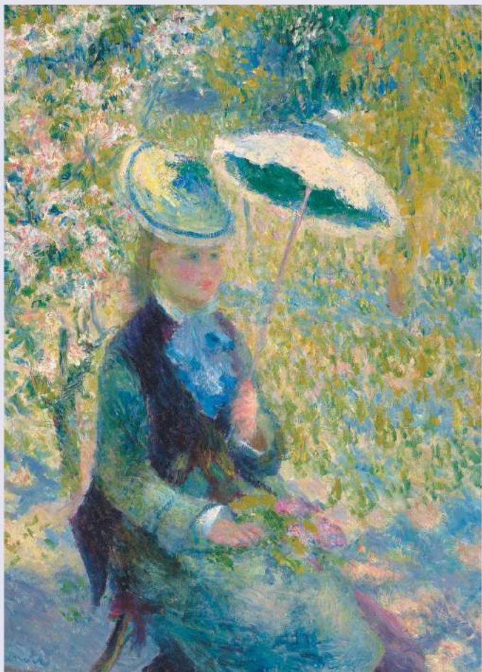
Pierre-Auguste Renoir L'ombrelle

Kobiety od zawsze były muzami dla malarzy, kompozytorów, pisarzy. Ich zmienna natura, piękno duchowe i fizyczne fascynowały artystów, pobudzały ich wyobraźnię i inspirowały do pracy twórczej. Kobieta często stawała się bohaterką utworu literackiego i muzycznego, wiele dzieł zostało jej zadedykowanych. Kompozycje, które dziś poznasz, są takimi przykładami.