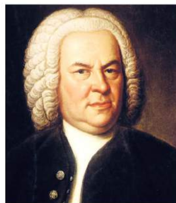
Autor nieznanym Portret Jana Sebastiana Bacha

W baroku, który trwał od końca XVI wieku do połowy XVIII wieku, kompozytorzy kontynuowali polifoniczną chóralną muzykę renesansu oraz rozwijali muzykę instrumentalną w takich formach, jak: fuga, suita, sonata, koncert solowy i concerto grosso [czyt. koncerto grosso]. Wokalno-instrumentalne formy, takie jak: msza, opera, oratorium i kantata dały wspólne podłoże dla późniejszego rozkwitu opery. Do czołowych kompozytorów epoki baroku należą m.in.: Jan Sebastian Bach, Georg Friedrich Händel, Antonio Vivaldi . Poznamy bliżej życie i twórczość Jana Sebastiana Bacha, uznanego za reprezentatywnego artystę tej epoki.