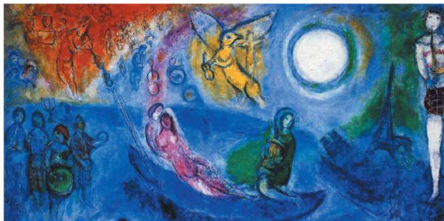
Marc Chagall Koncert

Słowo koncert ma wiele znaczeń. Powszechnie pod tą nazwą rozumie się publiczny występ muzyków. Pierwsze widowiska tego typu odbywały się już w starożytnej Grecji w odeonach – specjalnie do tego celu wznoszonych amfiteatrach. Później, w średniowiecznych kościołach, odgrywane były dramaty liturgiczne. W następnych epokach, kiedy mecenasami muzycznych koncertów stali się dwór królewski i bogate mieszczaństwo, artyści ze swoimi muzycznymi popisami przenieśli się do pałacowych komnat.