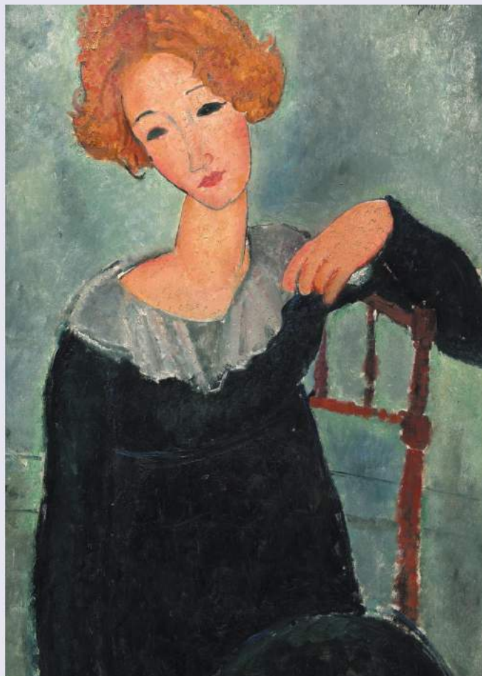
Amedeo Modigliani Dziewczyna z rudymi włosami