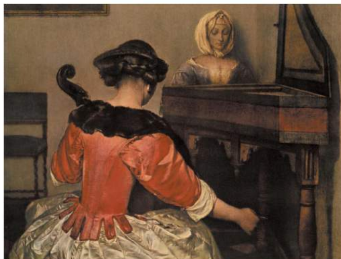
Gerard Ter Borch Koncert