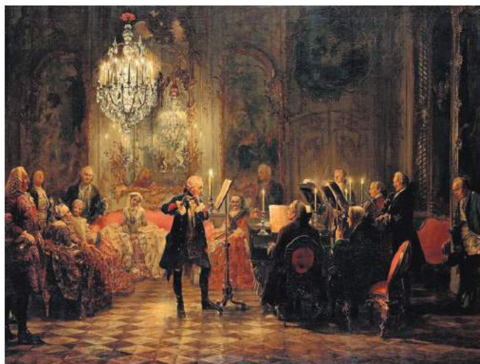
Adolph von Menzel Koncert na flecie

Słowo koncert ma wiele znaczeń. Powszechnie pod tą nazwą rozumie się publiczny występ muzyków. Pierwsze widowiska tego typu odbywały się już w starożytnej Grecji w odeonach – specjalnie do tego celu wznoszonych amfiteatrach. Później, w średniowiecznych kościołach, odgrywane były dramaty liturgiczne. W następnych epokach, kiedy mecenasami muzycznych koncertów stali się dwór królewski i bogate mieszczaństwo, artyści ze swoimi muzycznymi popisami przenieśli się do pałacowych komnat.