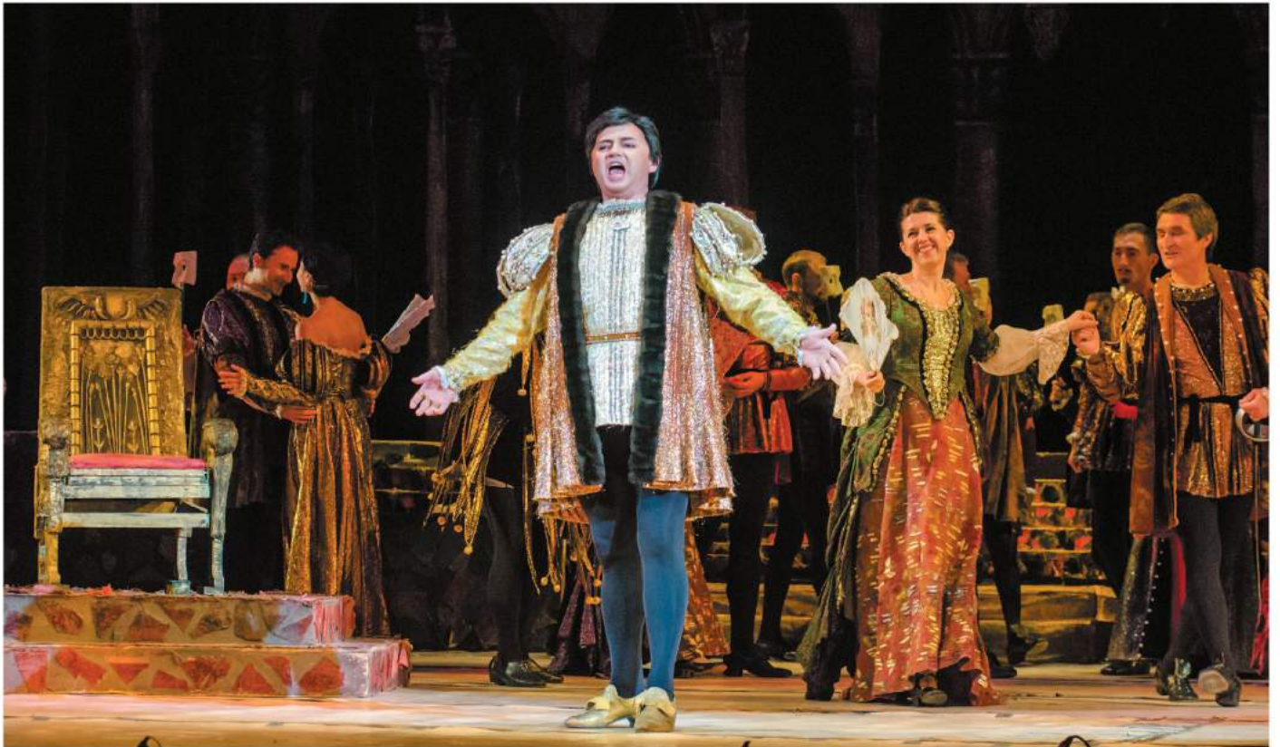
Scena z opery Rigoletto