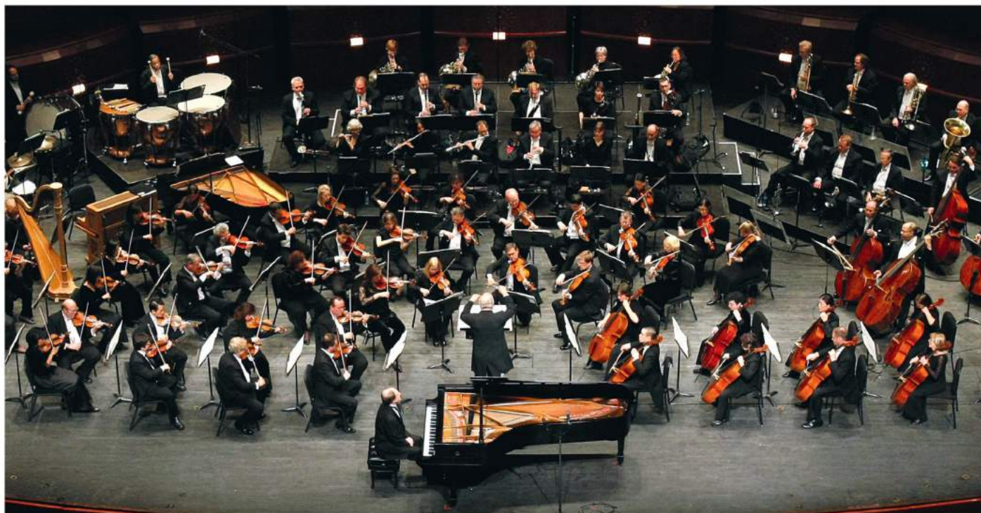
Solista z orkiestrą

Jednym z pierwszych twórców koncertu solowego był Antonio Vivaldi. Skomponował on ponad 450 koncertów na różne instrumenty, głównie smyczkowe. Wśród nich najbardziej znanym jest cykl koncertów na skrzypce solo i orkiestrę smyczkową Cztery pory roku , którego wybrane części poznaliście już wcześniej na lekcjach muzyki.