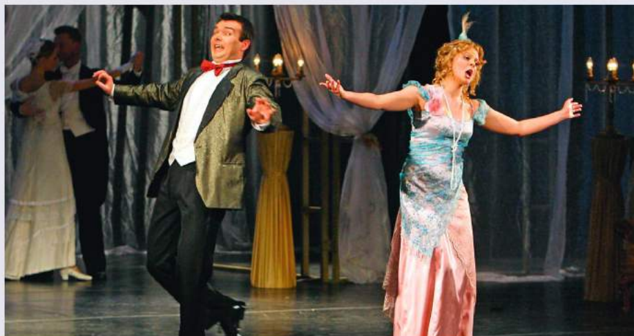
Scena z operetki Księżniczka czarodasza

Kompozytorzy uznawali często kobiety za muzy, które zsyłały na nich artystyczne natchnienie. Tak było w przypadku Roberta Schumanna [czyt. szumana], niemieckiego kompozytora okresu romantyzmu, którego wiele utworów powstało pod wpływem gorącego uczucia do Klary Wieck [czyt. wiek] – młodej, utalentowanej pianistki. Cóż to za istota z tej Klary! – pisał artysta o swojej ukochanej – Chociaż mierzy zaledwie trzy stopy wzrostu, jej serce jest tak dojrzałe, że budzi we mnie strach. W tej dziewczynie, w jej nagłych kontrastach, w mgnieniu oka objawiają się zmiany kapryśków i nastroje: śmiech i płacz, śmierć i życie. Kiedy Klara została jego żoną, często bywała pierwszym recenzentem i wykonawcą dzieł kompozytora. Pod jej namową Robert Schumann napisał Koncert fortepianowy a-moll op. 54 , z którym pianistka występowała z powodzeniem w wielu europejskich miastach.