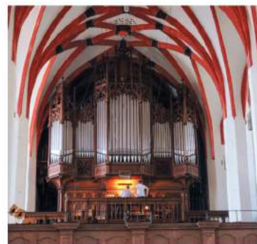
Wnętrze Kościoła św. Tomasza w Lipsku, Niemcy